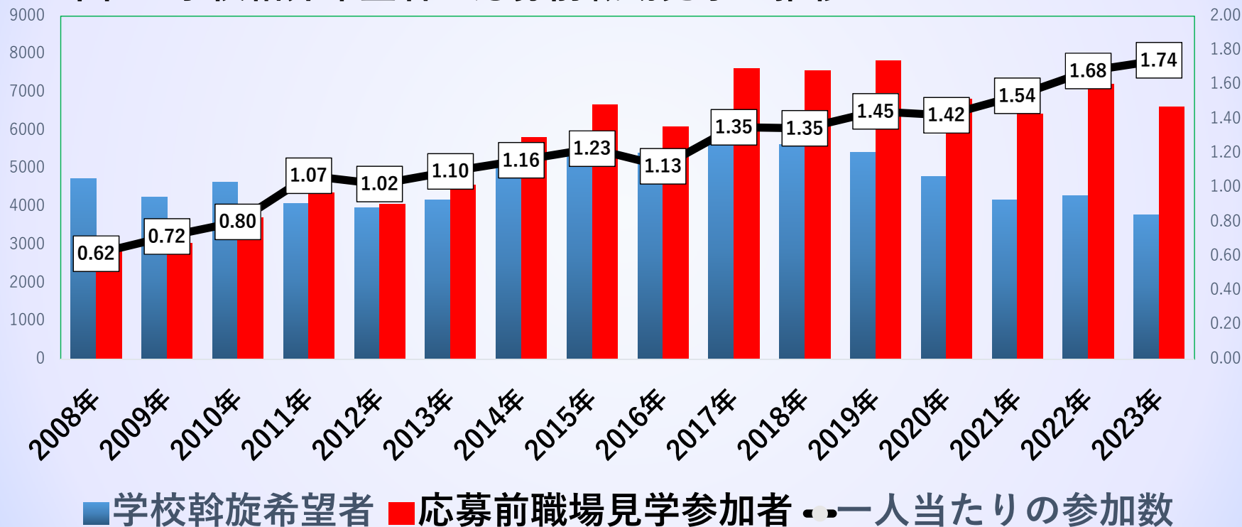
図2 学校紹介希望者と応募前職場見学の推移